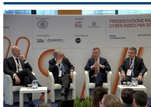
Un momento dell'evento